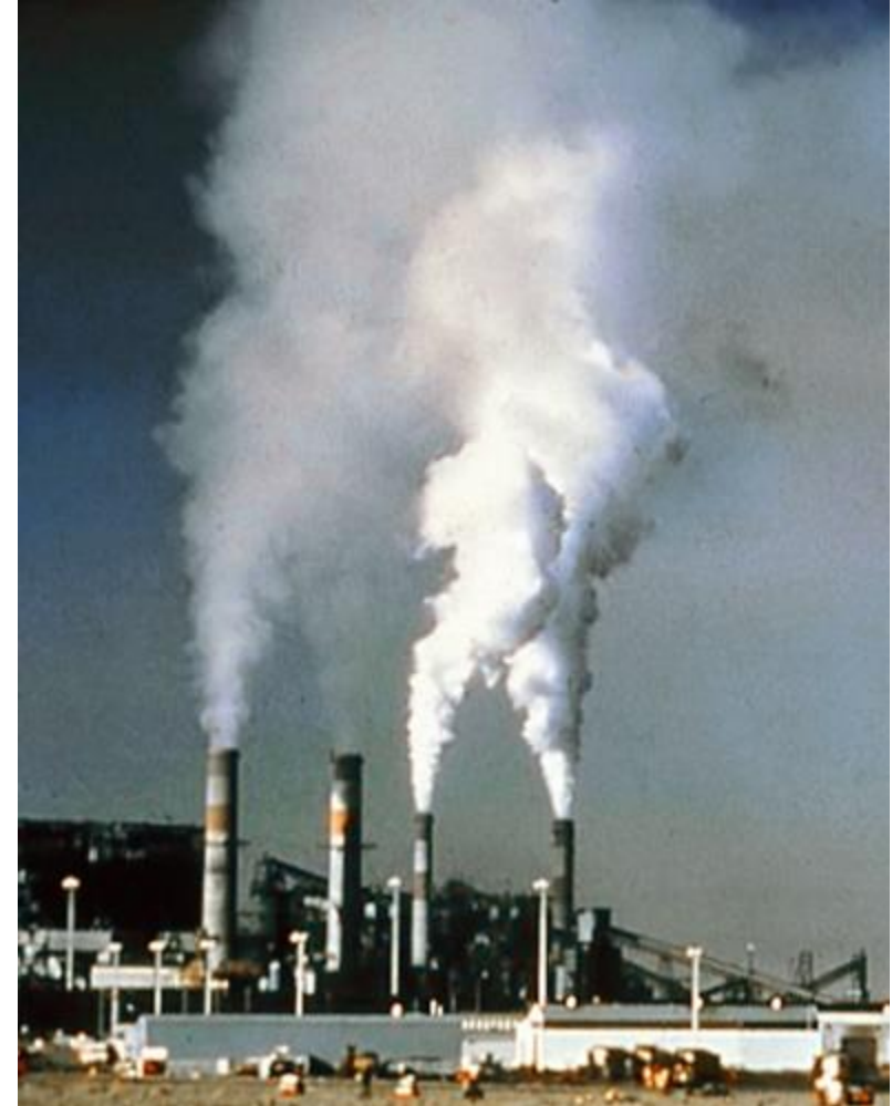
Wikipedia. Contaminación atmosférica