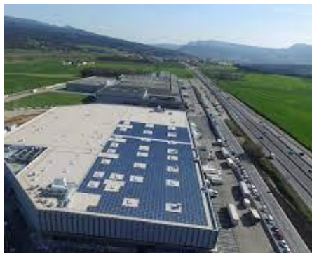
Comunitats energètiques locals a Osona