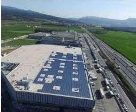
Comunitats energètiques locals a Osona