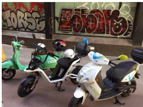
Exemple d'escúters elèctrics compartits a Barcelona.

Barcelona , juny de 2018, no hi ha cotxe elèctric compartit, en desconeixem la raó. Hi ha però com a mínim quatre empreses de motos elèctriques compartides (eCooltra, Muving, Yugo y Scoot) que en total deuen reunir al voltant d'un miler més d'escúters disponibles. Funcionen segons el model " floating ", és a dir, es poden estacionar a qualsevol lloc legal de la via pública però sempre dins d'una àrea urbana determinada per cada empresa.